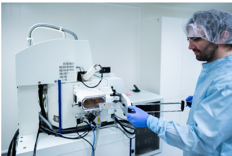
Čisté prostory pro výrobu nanostruktur pomocí litografických technik