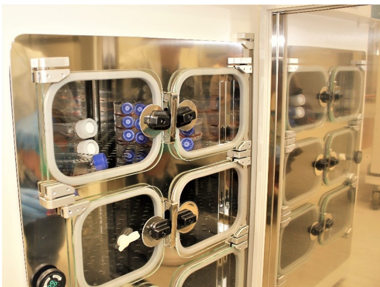
Foto: Přírodovědecká fakulta Univerzity Jana Evangelisty Purkyně – CO 2 inkubátor